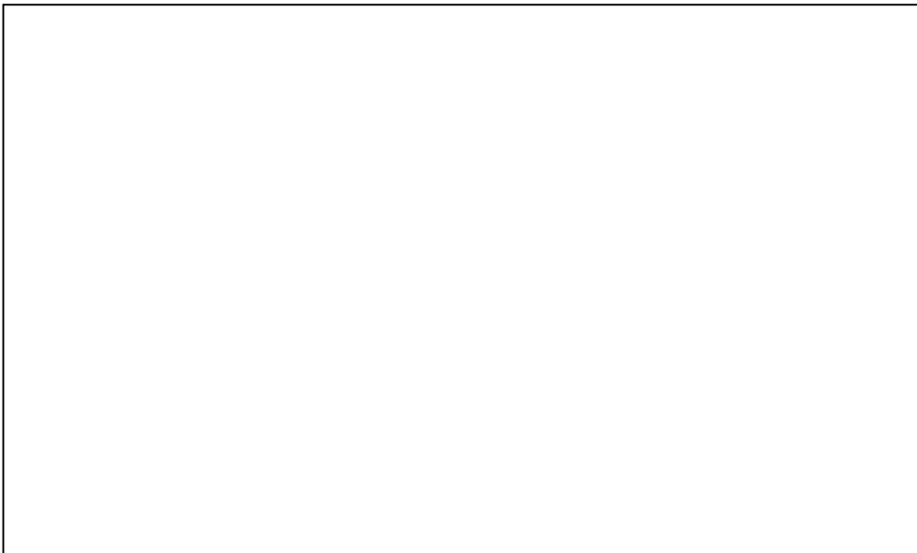
ภาพที่ ๒ (บรรยายภาพ).....